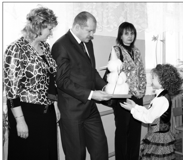
С благодарностью от учащихся