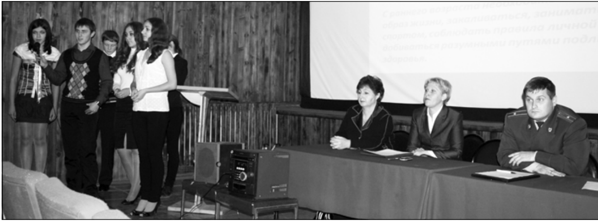
Выступление волонтеров МСОШ № 2

— под таким названием в конце ноября в кинотеатре «Мир» прошла встреча учащейся молодежи с представителями исполнительной власти района и правоохранительных органов. На мероприятии присутствовали и «трудные» подростки, поэтому основной целью стала профилактика асоциальных явлений среди молодежи и пропаганда здорового образа жизни.